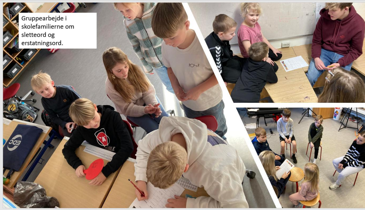
Gruppearbejde i skolefamilierne om sletteord og erstatningsord.