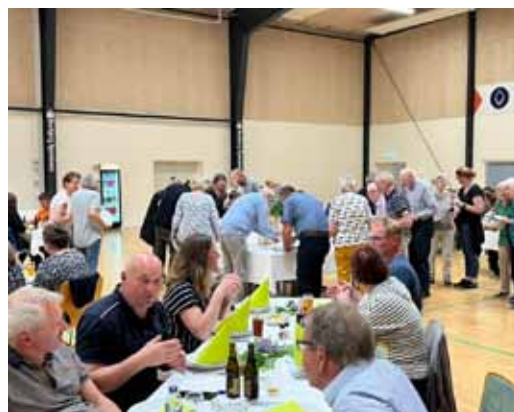
Madmødet i Multihuset

Der er mange gode grunde til at bevare lokale indkøbsmuligheder: man sparer tid og brændstof, da det ligger tæt på hjemmet; der er lokale arbejdspladser, også for ungarbejdere; personalet kender dig og giver personlig service; købmandsbutikken er et lokalt mødested og støtter lokale foreninger med sponsorgaver. En rundspørge i Dansk Ejendomsmæglerforening viser, at huspriser falder min 10%, og at liggetiden på huse til salg stiger, hvis købmanden lukker. Desværre lukkede vores købmand i september 2022 på grund af stigende energipriser og stigende konkurrence fra discountsupermarkeder. Efter lukningen blev der indkaldt til borgermøde med godt 200 fremmødte, som alle var enige om, at vi skulle arbejde for at få en ny butik startet op.