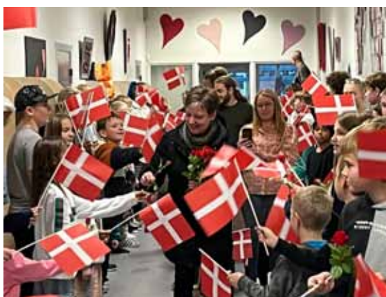
Sådan tager vi imod en ny skoleleder.