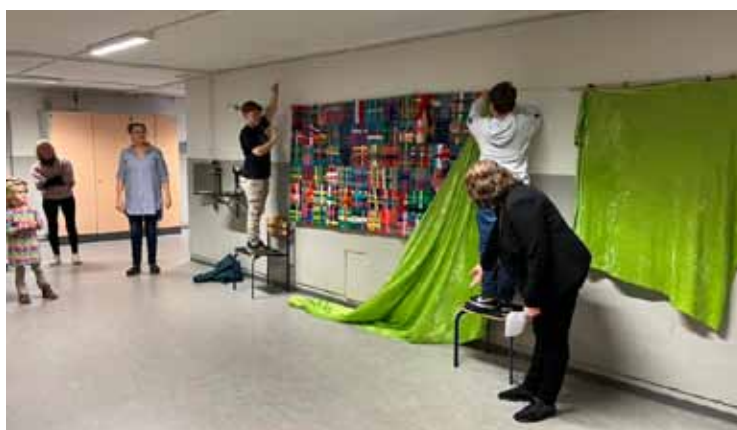
Afsløring af kunstværk i forbindelse med workshop.