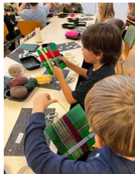
Viklekunst i skolen.

Vigtigheden i at bevare både børnepasning og skole i Skave er afspejlet i vores landsbystrategi, hvor dette er en del af indsatsområdet Hverdagservice. Skave Skole og Børnehus spiller en central rolle i at opbygge en stærk samhørighed og stolthed i lokalområdet.