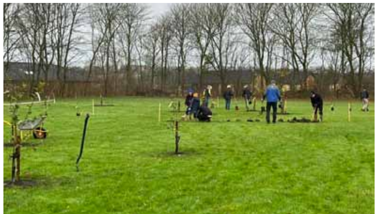
Store plantedag i Oasen.

"Oasen er med til at gøre vores landsby grønnere og mere bæredygtig. Danske bær og frugter reducerer CO 2 trykket, da de ikke transporteres med skib eller fly. Ved at dyrke frugt og bær lokalt ved skole og børnehus, bliver børn bevidste om, at de skal spise bær og frugt efter årstiden. De bær og frugt, der ikke bliver spist af mennesker, kan bruges som føde til insekter og fugle"