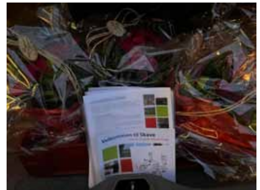
Velkomstbuketter og folder

Eksternt sender vi materiale om Skave til ejendomsmæglere, som har huse til salg i Skave. Vi sender jævnligt materiale til det lokale dagblad for at vise udadtil, hvad der foregår i Skave. Vi er startet med at lave Skave historier som en podcast, der skal kunne downloades via QR koder rundt i landsbyen.