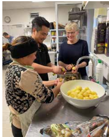
En god snak under kartoffelskrædning.

Der arbejdes på et nyt tiltag, som bliver et tilbud til ensomme i Skave og omegn – til dem der synes søndagen er alt for lang og stille. Hver anden søndag vil der være SøndagsTræf i Multihuset fra 14-16. Her vil der være forskellige aktiviteter som brætspil, bordtennis, fælles-sang, gamle spillefilm, foredrag og andet. Der vil blive serveret kaffe og brød. Skave Borgerforening bliver arrangør og får hjælp fra præsten og seniorklubben til at lokalisere de ensomme i lokalområdet. Målgruppen er unge som ældre, enlige og par – det kan også være enlige forældre med små børn. Der arbejdes pt. på en ansøgning til Vellivfonden til projektet, som forhåbentligt kan startes op i efteråret 2024.