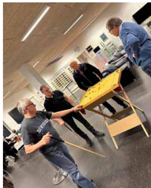
Bobspil til Farlig Fredag.

I vintersæsonen arrangerer den lokale gymnastikforening faste månedlige spilleaftner for voksne, der har lyst til at komme op af sofaen fredag aften. Det er både par og enlige, der kan deltage, da aktiviteterne lægger op til, at alle kan være med. Der spilles brætspil, bob, bowls, stige-golf og bordtennis. Konceptet er blevet døbt Farlig Fredag og er også en del af det sociale ansvar, der ligger i at tilbyde aktiviteter, som forhindrer folk i at føle sig ensomme.